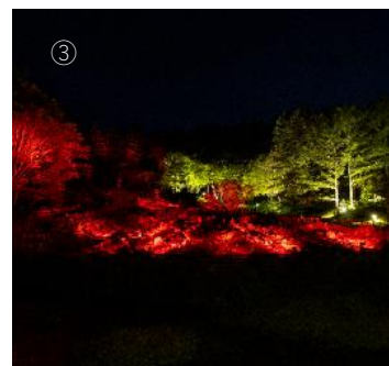
高橋匡太《キラ★キラ★キラリー～夜の絵具を探せ！～》2022年 六甲高山植物園

本作品は、来園者が園内を巡って、キラキラ光る色のかげらを集める体験型のアート作品です。