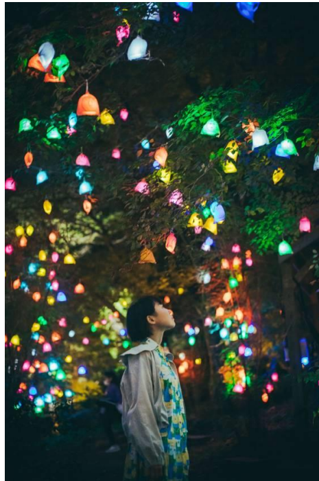
高橋匡太《ひかりの実 in SIKI ガーデン》2022年 ROKKO 森の音ミュージアム

本作品は笑顔が描かれた果実袋の中に、LED の小さな光を入れて木々に取り付け、あたたかな夜景を作り出します。今年は神戸市内の小中学生などが参加し約5,000の《ひかりの実》を会期を分けて2,500ずつ展示します。