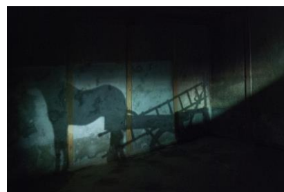
《stories - House -》瀬戸内国際芸術祭 2016 小豆島