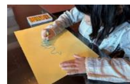
子どもプログラム

ワークショップ等を通じて自然の中で子どもたちが現代アートに触れられる機会を増やし、次世代の文化芸術の担い手や支え手を育てていきます。