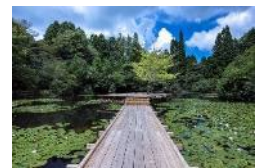
川俣正《六甲の浮き橋とテラス》

過去最多となる招待・公募を合わせた60組以上のアーティストの参加を予定しています。国内外から幅広い視点で活動しているアーティストの作品をご紹介します。また、公募作品の募集条件を向上し、より優れた作品を募集・展示します。