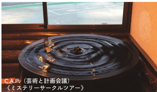
C.A.P. (芸術と計画会議) 《ミステリーサークルツアー》