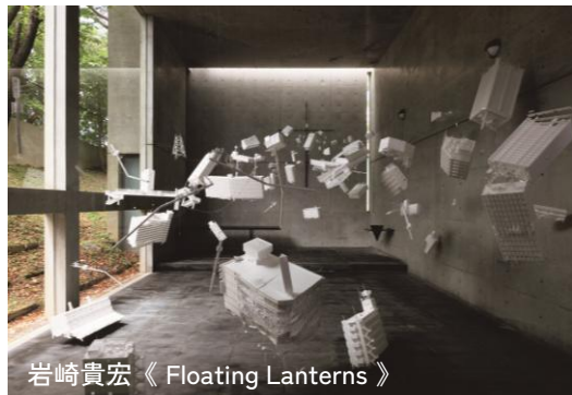
岩崎貴宏 《 Floating Lanterns 》

高野千聖、山羊のメリーさん、岩崎貴宏、松蔭中学校・高等学校 美術部、C.A.P.（芸術と計画会議）、堀尾貞治×友井隆之、イケミチコ、長雪恵、開発好明、チャール・ハルマンダル、Trivial Zero、園田源二郎、田中望、高橋銑、倉知朋之介、岡田裕子、川原克己