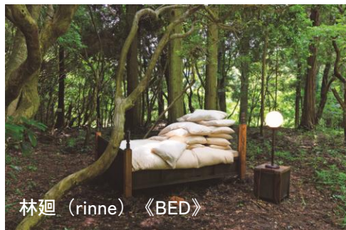
林廻 (rinne) 《BED》

小谷元彦、林廻 (rinne)、nl/rokko project、乾久子、C.A.P. (芸術と計画会議)