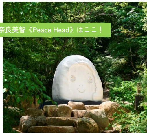
Artwork: ©Yoshitomo Nara