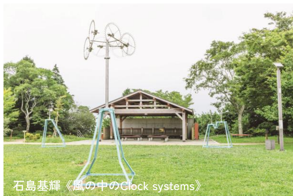
石島基輝 《風の中のClock systems》