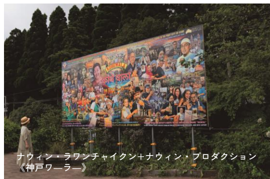
ナウイン・ラワンチャイクン+ナウイン・プロダクション 《神戸ワラー》